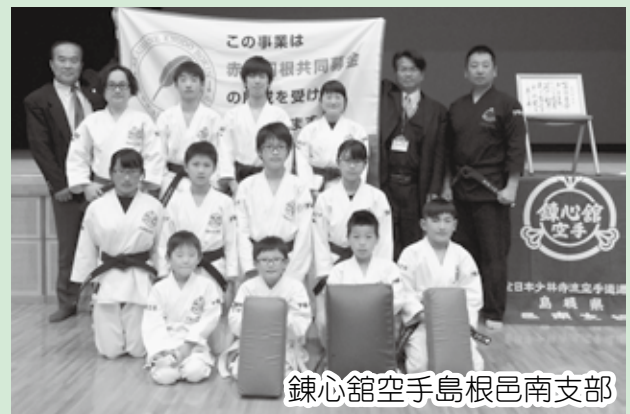
錬心館空手島根邑南支部