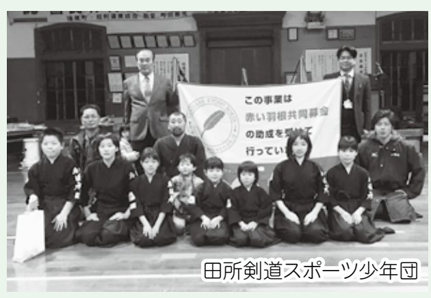
田所剣道スポーツ少年団