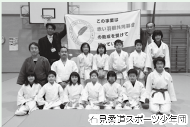
石見柔道スポーツ少年団

邑南町共同募金委員会では、平成27年度スポーツ少年団支援事業として、町内の5団体に物品助成を行いました。この事業は町内においてスポーツ活動・育成・交流等を積極的に試みる団体を支援するもので、それぞれの団体より申請のあった物品を贈りました。今年度もたくさんの子どもの頑張る姿やいきいきとした笑顔に出会うことができました。邑南町共同募金委員会は、各団体が今後ますます活発に活動されるよう応援していきます。