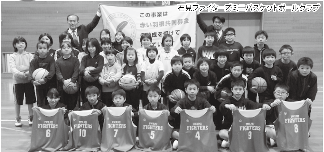
石見ファイターズミニバスケットボールクラブ

邑南町共同募金委員会では、平成27年度スポーツ少年団支援事業として、町内の5団体に物品助成を行いました。この事業は町内においてスポーツ活動・育成・交流等を積極的に試みる団体を支援するもので、それぞれの団体より申請のあった物品を贈りました。今年度もたくさんの子どもの頑張る姿やいきいきとした笑顔に出会うことができました。邑南町共同募金委員会は、各団体が今後ますます活発に活動されるよう応援していきます。