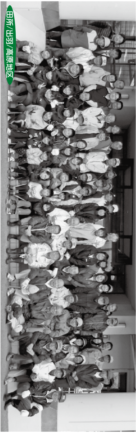
田所/出羽/高原地区