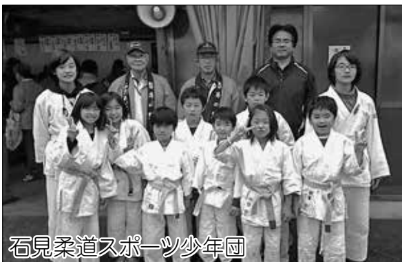
石見柔道スポーツ少年団

今年も町内のスポーツ少年団の協力を得て赤い羽根共同募金運動の街頭募金活動を実施しました。11月12日（土）、「道の駅みずほ」に於いて「田所剣道スポーツ少年団」が、11月20日（日）、「雲井の里」にて「石見柔道スポーツ少年団」が募金の呼びかけを行いました。当日はたくさんの方々が募金に協力して下さいました。ありがとうございました。