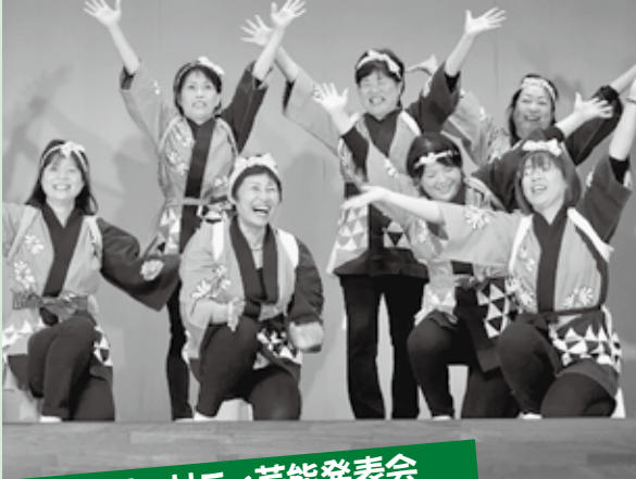
口羽チャリティ芸能発表会