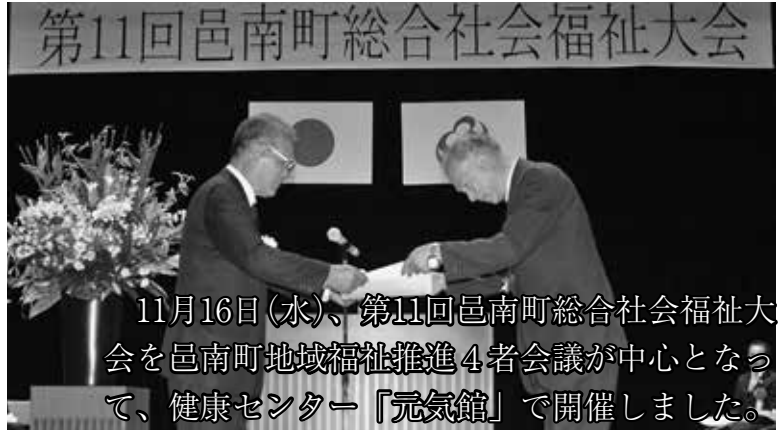
11月16日(水)、第11回邑南町総合社会福祉大会を邑南町地域福祉推進4者会議が中心となって、健康センター「元気館」で開催しました。

表彰式典では、これまで邑南町社会福祉協議会の法人運営や事業推進等に功績のあった方に対して邑南町社会福祉協議会会長表彰並びに感謝状の贈呈が行われ、続いて邑南町老人クラブ連合会会長表彰として26名の会員の方々への表彰も行われました。