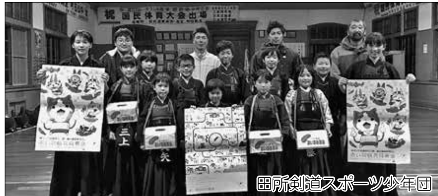
田所剣道スポーツ少年団