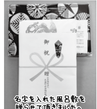
名字を入れた風呂敷を贈呈させて頂きました。

今年は153名（瑞穂31名、羽須美59名、石見63名）の方が対象で、各地区社協や自治会の敬老会、また福祉委員さんを通じてお祝状とお祝いの品を贈呈させていただきます。これからもどうぞお元気でお過ごしください。