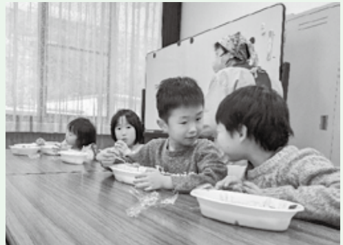
「つながり ささえあう みんなの地域づくり」