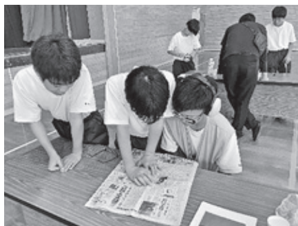
瑞穂中学校1年生のみなさんと 【高齢者疑似体験】

ふだんは利用者の車いすを 押す側だけど、自分が乗る と声掛けの大切さを改めて 実感した！