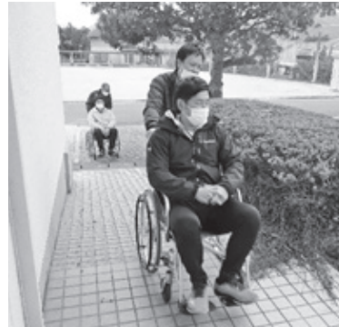
四つ葉の里職員のみなさんと 【車いす体験】

ふだんの暮らしを幸せに送っていくために、「自分には何ができるかな？」と、考える機会を一緒につくってみませんか？