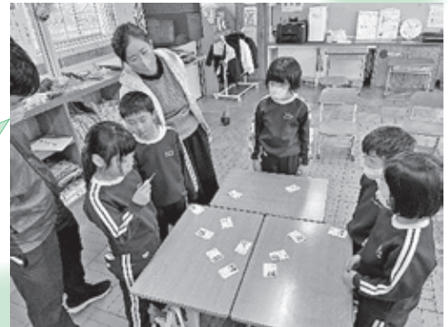
高原小学校1年生のみなさんと 【ふくしのおはなし・ふくしかるた】

ふくしはしあわせという 意味だと分かった。 やさしい言葉をかけられ るようになりたい！