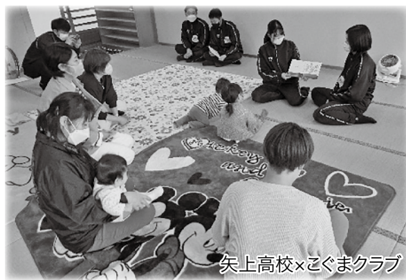
矢上高校×こぐまクラブ

今年度も矢上高校3年生家庭科選択科目「生活と福祉」に参画させていただきました。コロナ禍だからこそ、福祉のこころの育成、地域の方との繋がり強化に力を入れて行ってきました。関係機関・団体などと交流をすることで地域への興味・関心、ふるさと意識を育み、将来地域を思いやる意識へ繋がっていくのではないかと考えます。