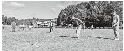
※当日のプレーの様子