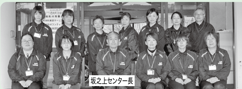
坂之上センター長

入居されている皆様が、自立した生活を送り続けて頂けるよう、土・日・祝日はもちろん夜間も見守って参ります。