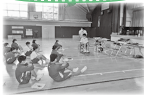
※操作や部位、気を付けることについて説明