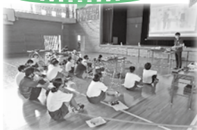
※「学び」や「気づき」の説明