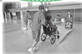
※スロープや段差の上り下り等体験