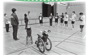
※感想発表やグループで話し合う等