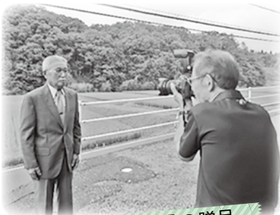
敬老の日記念品の贈呈