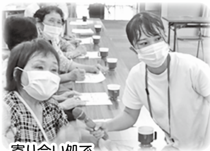
寄り合い処で『脳トレゲーム』をしました！