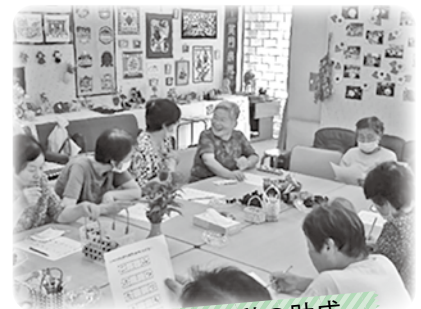
小地域福祉活動の助成