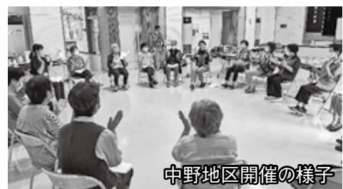
中野地区開催の様子

新聞紙を使った体操や脳トレ、しおり作りや会員によるハーモニカの生演奏など各地区で様々な内容により行いました。参加者からは「出るところがなくとても嬉しい」「久々にたくさん笑ったよ」と元気に再会できた喜びの声を聞くとともに、コロナに負けず頑張ろう!!と次回の再開を約束し笑顔いっぱいの交流会となりました。