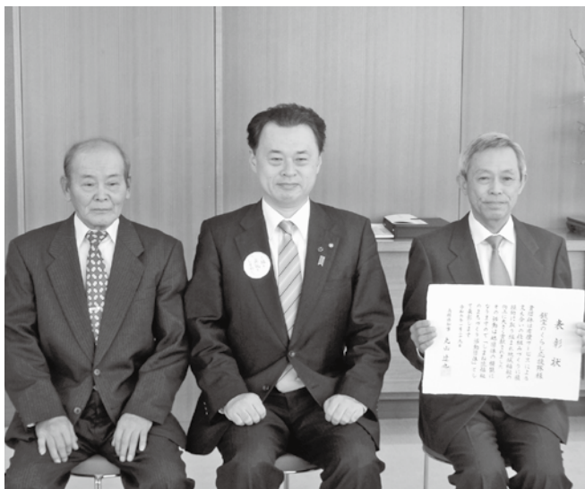
布施地区 銭宝のくらし応援隊 様