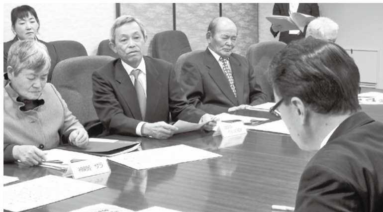
丸山知事との懇談の様子