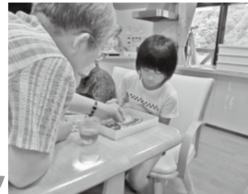
グループホームあすなる