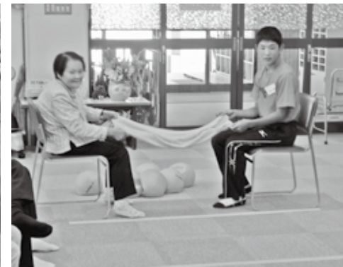
社協介護予防デイサービス