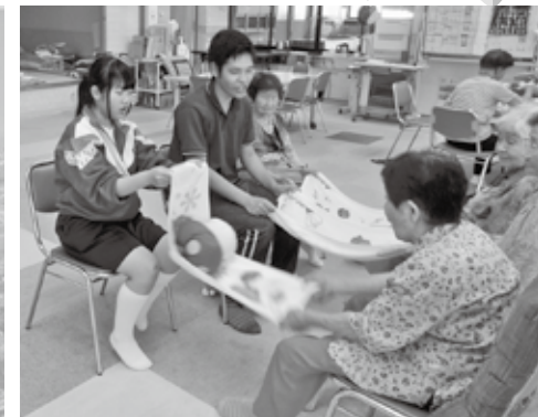
瑞穂西デイサービスセンター