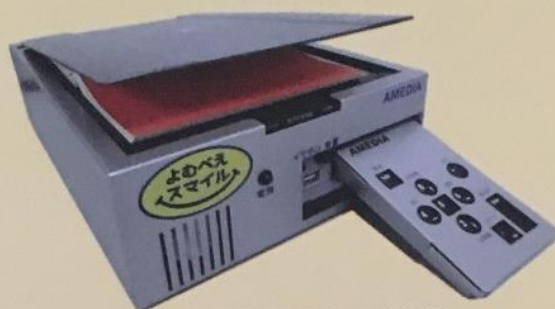
活字文書読上げ装置