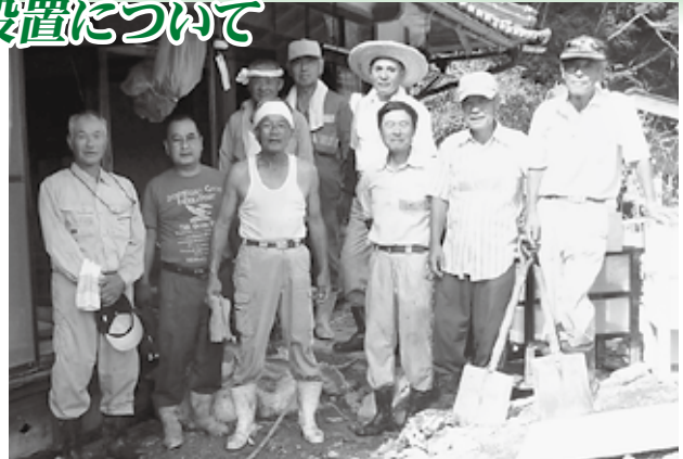
「8.24豪雨災害」には、延べ160人の町民の方々が災害ボランティア活動に協力して下さいました。

邑南町ボランティアセンターでは、昨年の「8.24豪雨災害」から学んだ教訓を今後の災害への備えのとして「邑南町災害ボランティアバンク」を設置し登録の呼びかけを行っています。災害発生時に被災地などでボランティアとして活動をする意思のある個人又は団体を事前に把握・登録しておくことで、災害発生後のボランティア活動を迅速かつ円滑に支援することを目的としています。