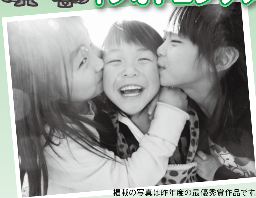
掲載の写真は昨年度の最優秀賞作品です。

2月28日(日)に元気館で行われるわくわくフェスタ2016で社会福祉協議会は、「つながり」をテーマとした「フォトコンテスト」を開催します。見ていると思わず笑顔になってしまう。みんなのこころを元気にしてくれる。温かくて、優しい気持ちにしてくれる。そんな「おおなんっ子」の写真をたくさん展示いたします。