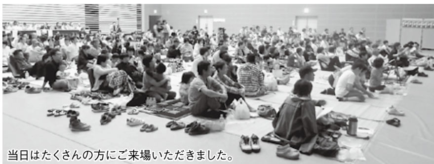
当日はたくさんの方にご来場いただきました。