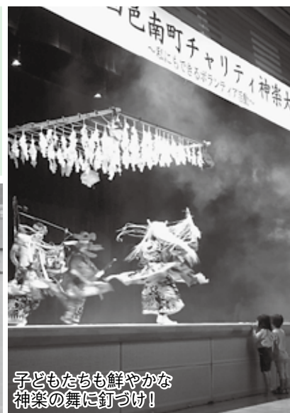
子どもたちも鮮やかな神楽の舞に釘づけ!