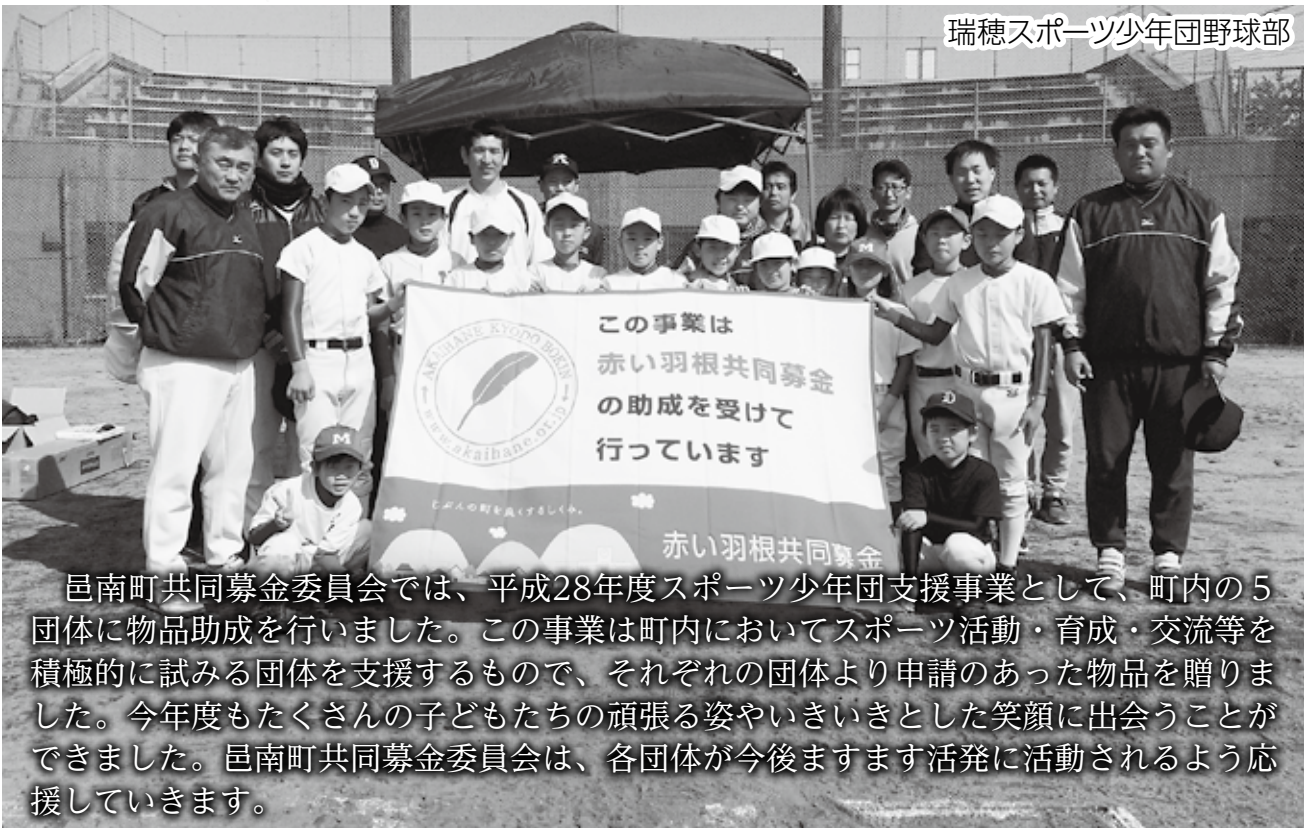
瑞穂スポーツ少年団野球部

邑南町共同募金委員会では、平成28年度スポーツ少年団支援事業として、町内の5団体に物品助成を行いました。この事業は町内においてスポーツ活動・育成・交流等を積極的に試みる団体を支援するもので、それぞれの団体より申請のあった物品を贈りました。今年度もたくさんの子どもたちの頑張る姿やいきいきとした笑顔に出会うことができました。邑南町共同募金委員会は、各団体が今後ますます活発に活動されるよう応援していきます。