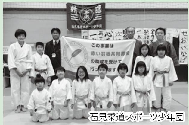
石見柔道スポーツ少年団

赤い羽根共同募金により当チームに物品を提供していただき感謝しています。今回はベース、投球板という高額な備品を寄贈していただき、これにより更に充実した環境になり選手たちも日々の練習に気合を入れて取り組んでいます。選手たちが日々、大好きな野球に打ち込めるのも「赤い羽根共同募金」によるおかげと感謝しています。