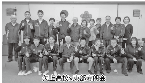
矢上高校×東部寿朗会

今年度も矢上高校3年生家庭科選択科目「生活と福祉」に参画させていただきました。福祉教育を通じて、相手を思いやるふくしの心が人と人をつなぎ、その心が人から地域へ広がると考えます。学校や関係機関、地域の皆さまのご協力により様々な地域とのつながりの場を創出することができました。ありがとうございました。