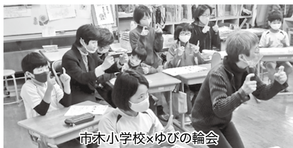
市木小学校×ゆびの輪会

今後も福祉意識を継続され、学校内や地域との関わりを一層深めていただきたいと思います。