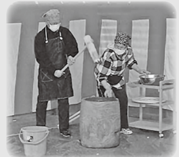
くにびき学園OB邑智会 もちつき会(緑風園)