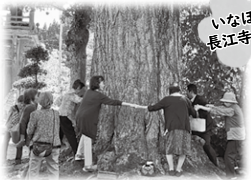
いなほ会 長江寺見学