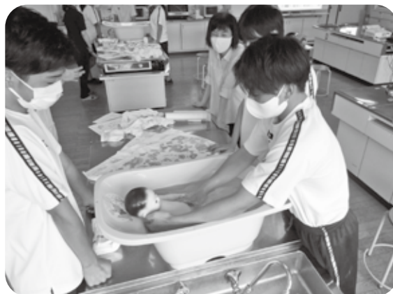
据わっていない首をしっかり支えてベビーバスへ

体験を通じて、自分で感じたことを自分たちがお父さんお母さんになった時の参考にして、愛の溢れる育児ができる土台作りの一つになればと思います。