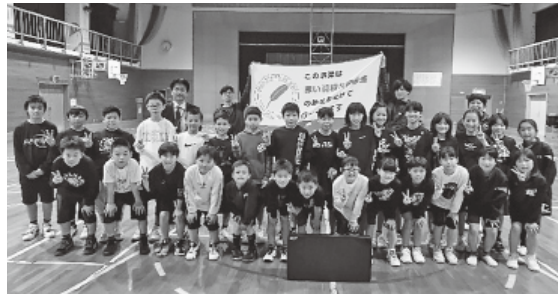
【スポーツ活動支援事業】