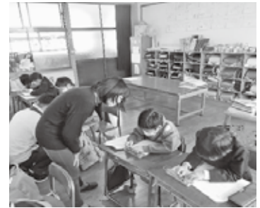
【福祉教育推進事業】