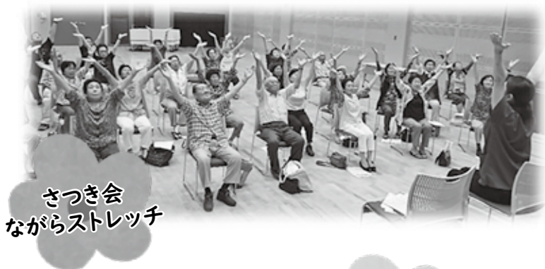
さつき会 ながらストレッチ