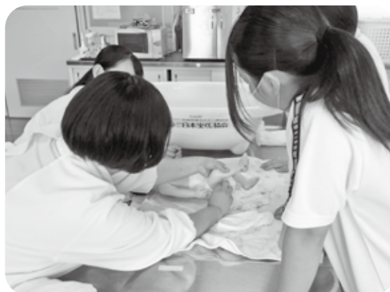
オムツの当て方の大事なポイントも教わりました