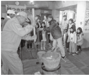
【歳末世代間交流会】