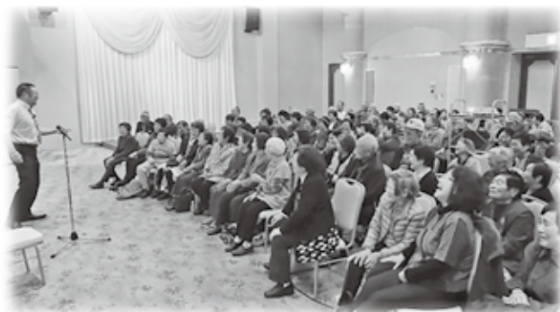
平成30年度の総会の様子

今年度は新型コロナウイルス感染拡大の観点から、総会等開催できていない状況ですが、三密を避け今できる活動を行っていく予定です。