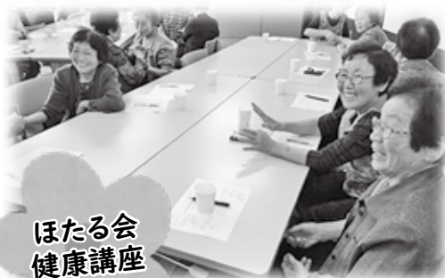
ほたる会 健康講座