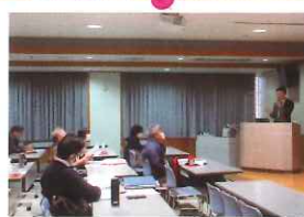
専門的な知識の習得