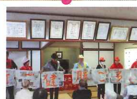
いきいきと活動できる場